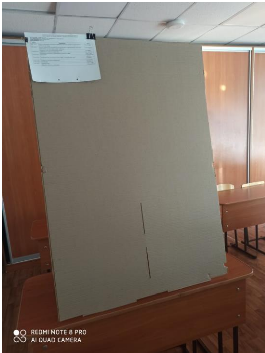
● ○ REDMI NOTE 8 PRO ○ ○ AI QUAD CAMERA