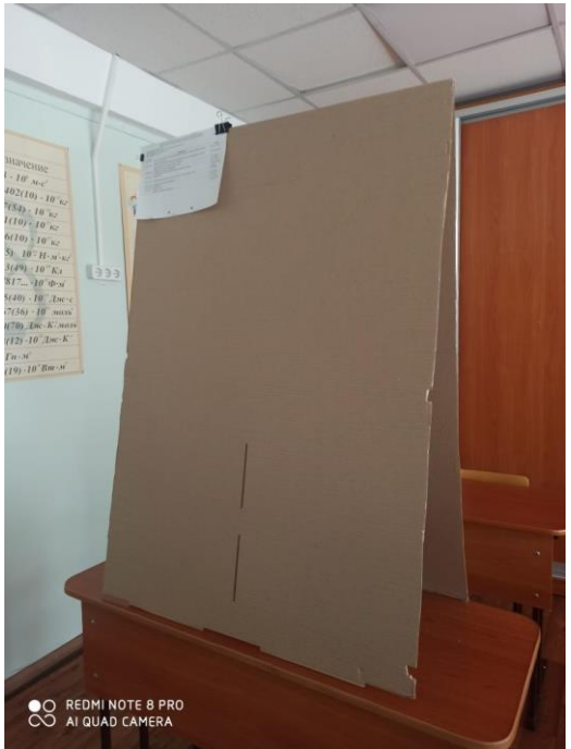
● ○ REDMI NOTE 8 PRO ○ ○ AI QUAD CAMERA