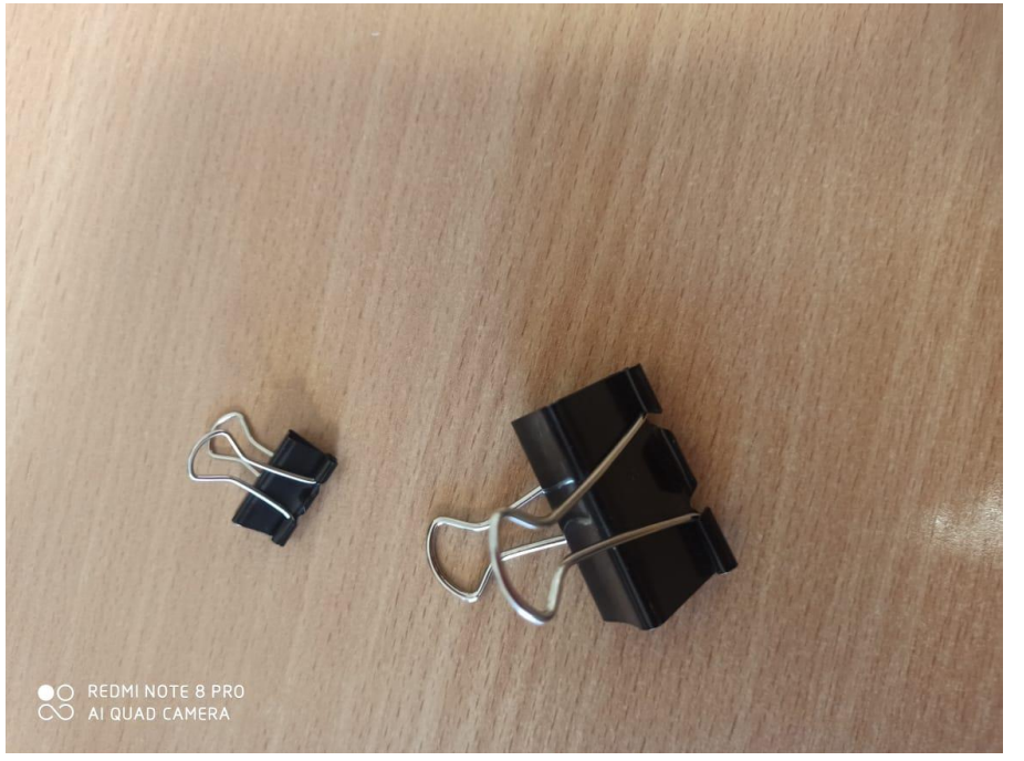
● ○ REDMI NOTE 8 PRO ○ ○ AI QUAD CAMERA